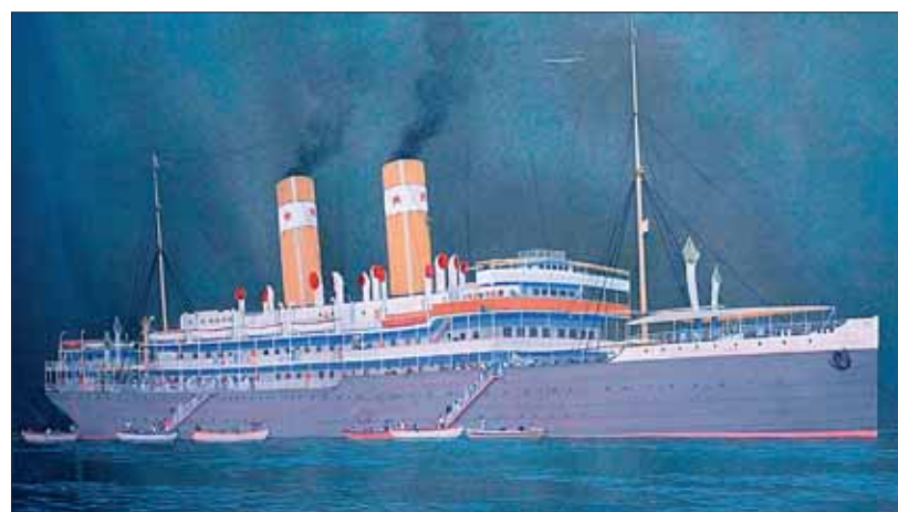
Premier des dix paquebots construits aux Ateliers et Chantiers de France (ACF), l'« Asie » assurait la liaison entre la métropole et les colonies françaises d'Afrique.

Réputés pour leur savoir-faire en matière de construction de pétroliers et de méthaniers, les Ateliers et Chantiers de France ont également fabriqué quelques magnifiques palais flottants comme en témoigne l'exposition temporaire présentée par le Musée portuaire jusqu'au 5 janvier.