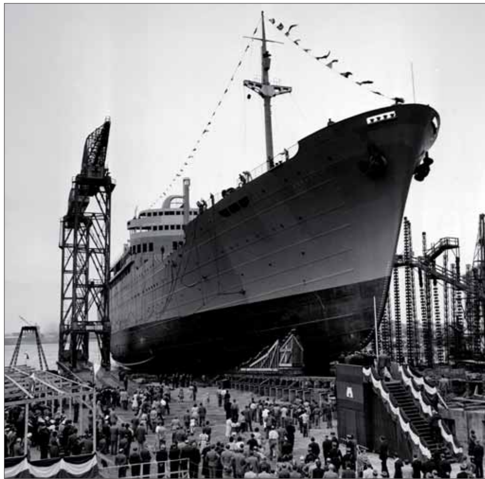
Livré à la compagnie des Messageries Maritimes en 1953, le « Cambodge » fut le dernier des paquebots construits à Dunkerque à naviguer. Sa carrière ne prit fin qu'en 2002.

rebaptisé « Stella Solaris ». Dès lors commence pour lui une belle carrière de paquebot de croisière qui ne prendra fin qu'en 2002. Trop vieux pour continuer à naviguer, il termine sa vie dans un chantier de démolition de la baie d'Alang en Inde. Dernier des paquebots dunkerquois à avoir sillonné les mers du globe, le « Cambodge » reste, à l'instar du « Calédonien », un navire de référence pour les armateurs.