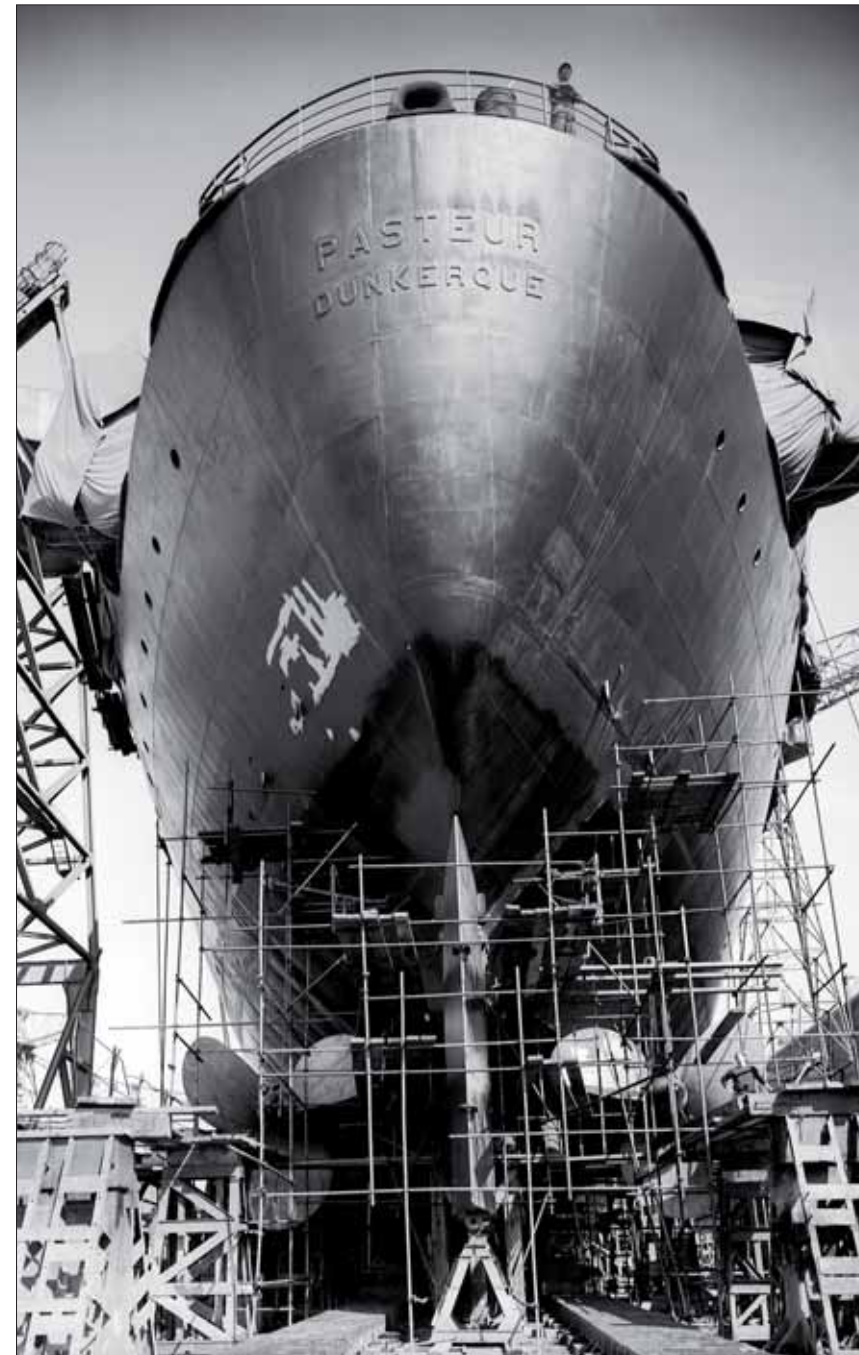
Élegant et ultramoderne, le « Pasteur », dernier des paquebots commandés aux ACF, figurait à son lancement en 1966 parmi les plus imposants de la flotte commerciale française.

d'été en Baltique et au Portugal. Premier des paquebots de la Compagnie Générale Transatlantique à desservir la liaison estivale Le Havre-Leningrad en 1937, il est réquisitionné par la Marine nationale en 1939. Reconverti en croiseur auxiliaire à Cherbourg puis en navire de transport de troupes à New York et enfin en navire-hôpital en 1944, il participera à l'expédition de Norvège en 1940, au rapatriement des troupes françaises de Syrie en 1941 et à la bataille du Pacifique à la fin de la guerre. Restitué à la France et à la Compagnie Générale Transatlantique au lendemain de la Libération, il est remis en état et profondément modernisé par les chantiers hollandais de Schelde. Remis en service sur la ligne des Antilles durant une dizaine d'années (1950-1961), il sert quelque temps au transport du contingent antillais faisant son service militaire en métropole avant d'être finalement vendu à un armateur grec en 1964. Rebaptisé « Atlantic » puis « Atlantica », il navigue en Méditerranée jusqu'à la liquidation de la compagnie en 1968. Immobilisé et désarmé, il est ferrailé à Barcelone en 1974.