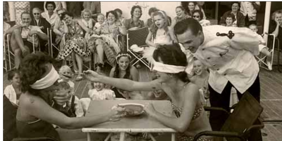
Durant leur long séjour à bord, les passagers pouvaient se détendre et s'amuser en participant à diverses activités proposées et encadrées par les membres d'équipage.