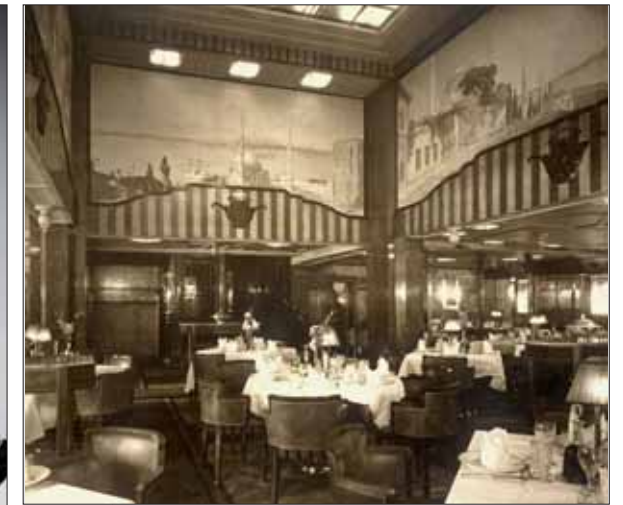
Conçus comme de véritables palaces flottants, les paquebots dunkerquois offraient aux plus fortunés des conditions d'accueil dignes des plus grands hôtels parisiens. Ici, une des salles à manger du « Théophile Gautier ».

tionnelles 727 passagers servis par quelque 405 membres d'équipage. Affecté à la ligne transatlantique Le Havre-Southampton-New York jusqu'à l'arrivée du mythique « France » en 1962, il poursuit ensuite sa carrière sur la ligne des Antilles et de l'Amérique centrale jusqu'en 1968, année au cours de laquelle il est cédé à la société italienne Costa Armatori. Modernisé et rebaptisé « Carla. C », il commence une nouvelle vie de navire de croisière dans l'océan Pacifique et les Caraïbes. Renommé « Carla Costa » au milieu des années 1980 puis « Pallas Athéna » à la suite de son rachat par un armateur grec en 1992, il est ravagé deux ans plus tard par un incendie qui le condamne à la destruction.